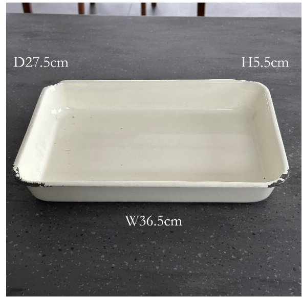
4-10 アンティークバット (¥550)