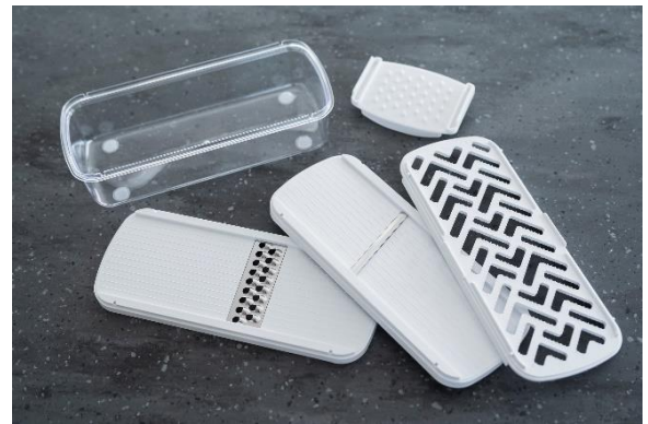
4-32 スライサーセット