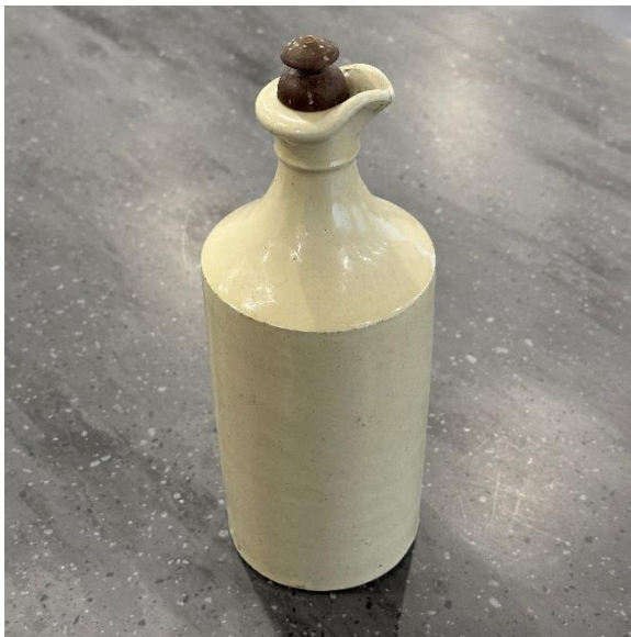
4-51 アンティークボトル