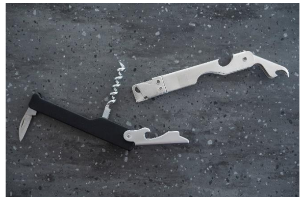
4-30 ワインオープナー 缶切り