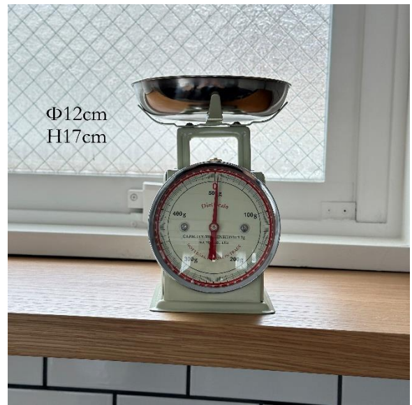
4-12 キッチンスケール (¥550)