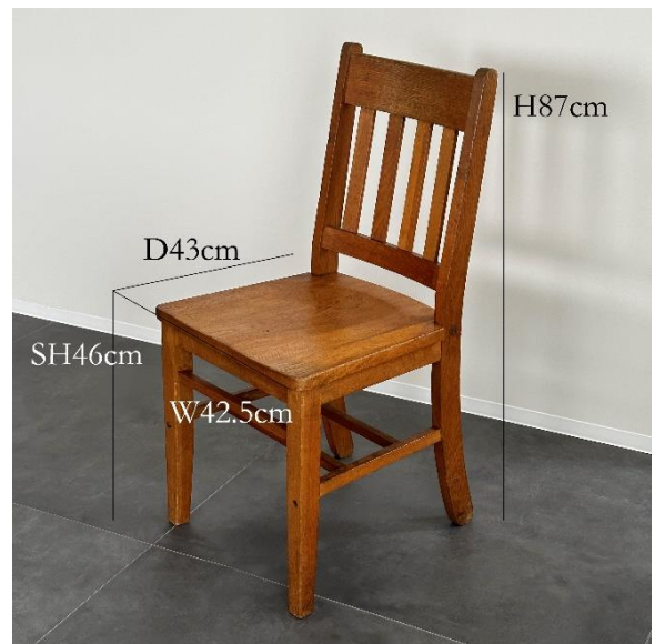
4-02 ダイニングチェア (¥1,100)