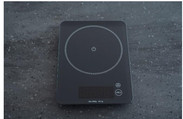
4-28 キッチンスケール