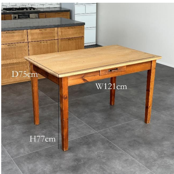
4-05 ダイニングテーブル