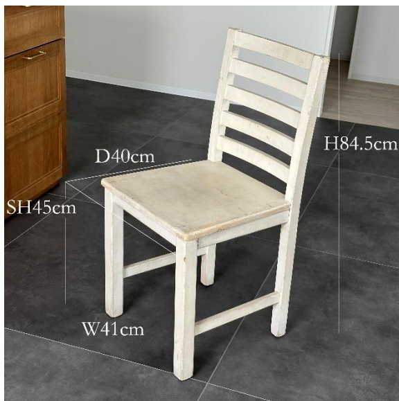
4-03 チェア (¥1,100)