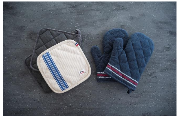
4-26 鍋敷き オープンミトン