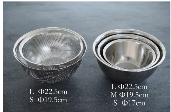
4-20 パンチングボウルとボウル