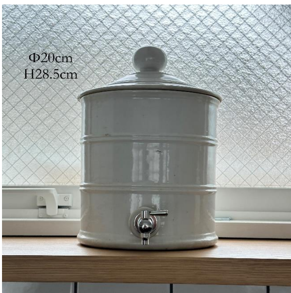
4-11 ウォータータンク (¥1,100)