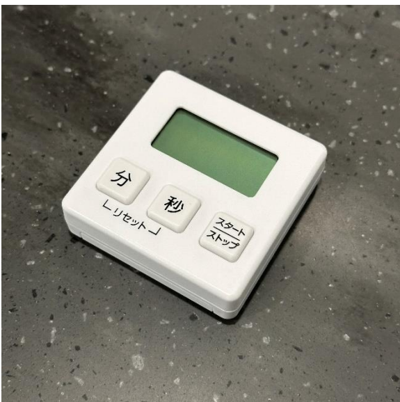
4-53 キッチンタイマー