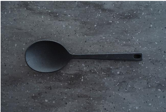
4-43 シリコンスプーン