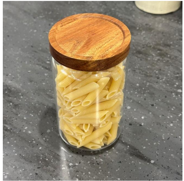
4-50 ガラスキャニスター