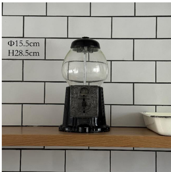
4-09 ガムボールマシン (¥1,100)