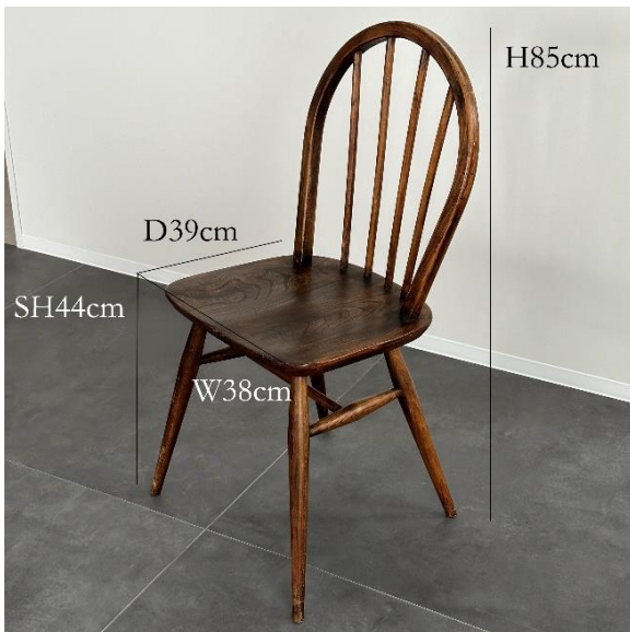
4-01 ダイニングチェア (¥1,100)